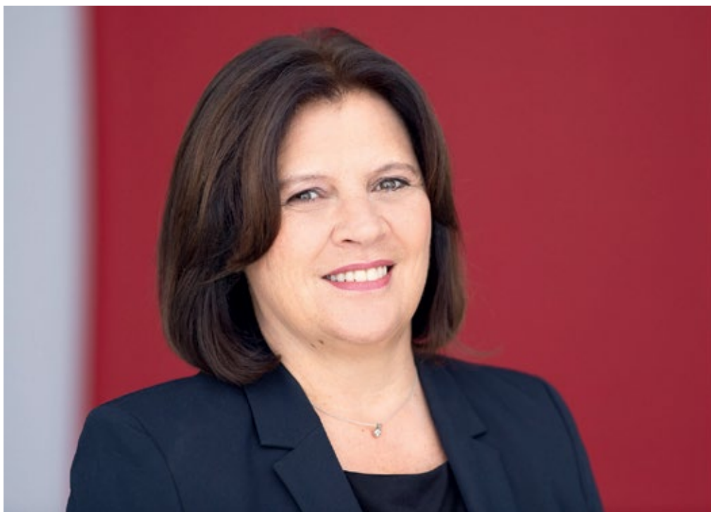
Renate Anderl AK PRÄSIDENTIN

„ Damit Beruf und Familie für Mütter und Väter gut vereinbar sind, müssen die arbeitsrechtlichen Regelungen und das Kinderbetreuungsgeld gut zusammenpassen und bürokratische Hürden beseitigt werden. Dafür setzt sich die AK ein.